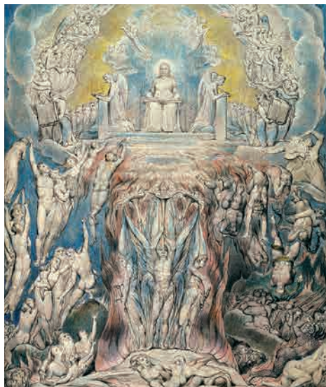
William Blake. The day of Judgement (1808).

Der var en gang for ikke så mange år siden, hvor kirken var det eneste sted, man kunne høre om dommen. Det betød så også, at selv trofaste kirkegængere havde det med at holde sig hjemme sidste søndag i kirkeåret, for livet er jo hårdt nok i forvejen, og hvorfor også ødelægge den gode stemning. Sådan er det ikke længere. For jeg skal love for, at kirken efterhånden er blevet overhalet godt og grundigt indenom af tidsånden. I dag møder vi oftest domsprofeterne