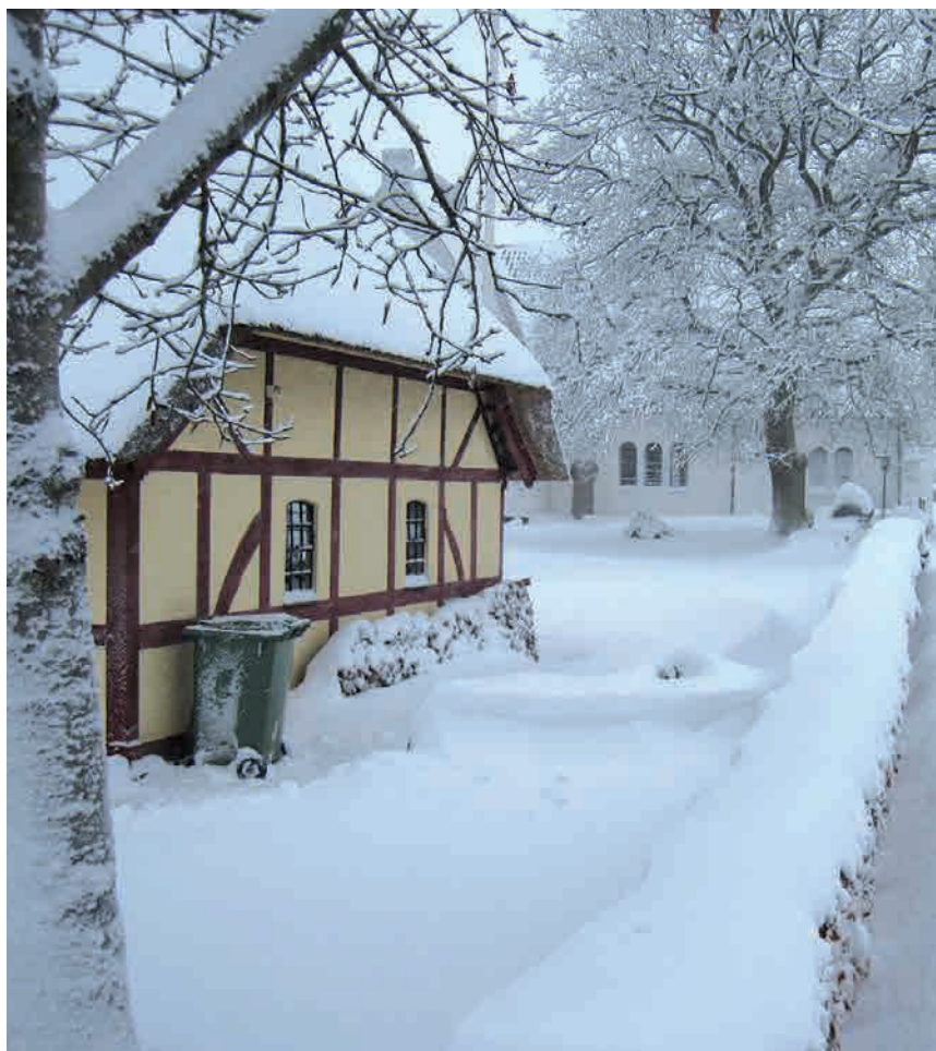
Konfirmandstuen og Nazarethkirken i snedragt.