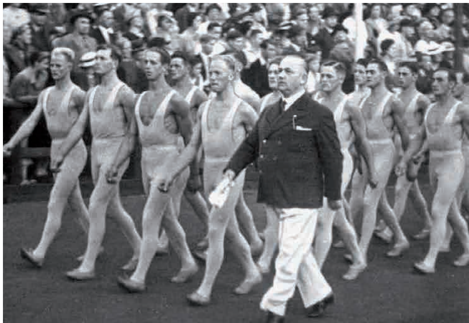
Niels Bukh og gymnaster til stævne i 1935.

I løbet af året 2020 markeres 100-året for indvielsen af Gymnastikhøjskolen i Ollerup. Udover at der er noget sær-