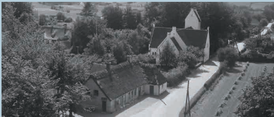
Nazarethkirken, luftfoto fra 1957.