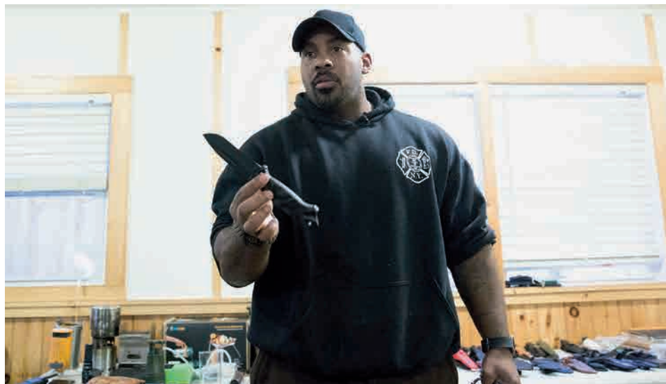
En Doomsday-prepper gør sig klar.

Og hvad var det hun sagde – den 16-årige, svenske Jeanne D'Arc – på mødet i Davos tidligere i år: »Vores hus brænder. Og jeg vil ikke have jeres håb. Jeg vil ikke have, I er håbefulde. Jeg vil have, I går i panik. Jeg vil have I føler frygt hver eneste dag. Og så vil jeg have jer til at handle som i en krise. Jeg vil have jer til at handle, som hvis der var ild jeres hus. For det er der.«