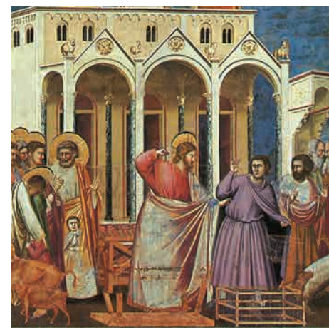
Jesus driver krejlerne ud af templet. Giotto fresker i Scrovegnikapellet.

Men måske skal vi ikke fryde os alt for meget, for måske er det lige så meget os, Jesus er ude efter. Det kan nemlig ikke nytte noget, at vi altid kun tror, at det handler om de andre og ikke om os selv. Og hvis vi blot lytter en lille smu-