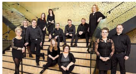
Kor a la Carte.

Tid: Søndag d. 27. oktober kl. 17.00. Sted: Nazarethkirken