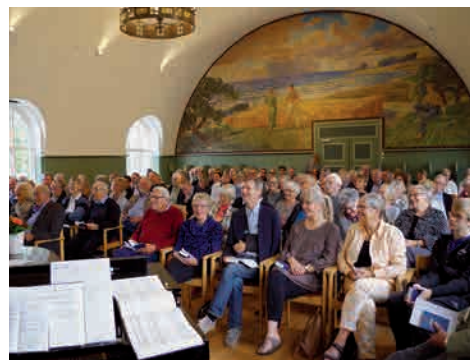
Fra foredragssalen på Ryslinge Højskole.

Tid: Søndag d. 6. januar kl. 13.00-17.00 Sted: Nazarethkirken, derefter Ryslinge Højskole Entré.