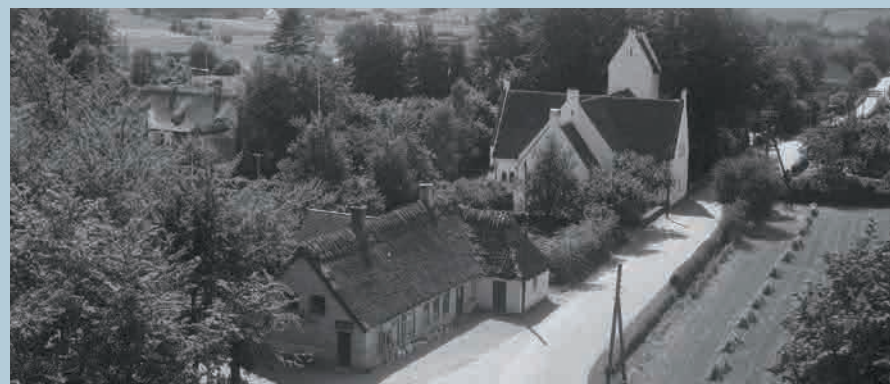
Nazarethkirken, luftfoto fra 1957.

Den 25. august blev der afholdt en ekstraordinær generalforsamling for Ryslinge Frimenighed. På dette møde gav menigheden bestyrelsen sit tilsagn om, at optage et kreditforeningslån på maks. 900.000 kr. Ydermere erklærede forsamlingen sig indforstået med, at Nazareth-